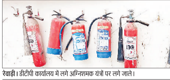
रेवाड़ी। डीटीपी कार्यालय में लगे अग्निशमक यंत्रों पर लगे जाले।

जिला सचिवालय से लेकर अन्य स्थानों पर सरकारी दफ्तरों में फायर एक्सटिंग्विशर तो लगे हुए हैं, लेकिन अधिकांश की एक्सपायरी डेट खत्म हो चुकी है। डीटीपी कार्यालय में लगे फायर एक्सटिंग्विशर पर जाले व पंखियों की गंधौनी जमी हुई है। ऐसा लगता है लंबे समय से यंत्रों को चैक तक नहीं किया गया है। इन एक्सटिंग्विशर से छोटी आग की घटनाओं पर काबू पाने की कल्पना भी नहीं की जा सकती। वहीं नगर परिषद परिसर में लंबे समय से एक भी फायर एक्सटिंग्विशर नहीं है, जबकि यहां प्रतिदिन सैकड़ों लोगों का आवागमन रहता है।