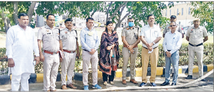
रेवाड़ी। विद्यार्थियों को शपथ दिलाते हुए पुलिस टीम।

उन्होंने प्रबंधन के अधिकारियों से विस्तृत जानकारी ली। कंपनी में आग के बाद लापता कर्मचारियों का अभी तक कोई सुराग नहीं मिला है। एक कर्मचारी की मौत हो चुकी है, जबकि एक अन्य की हालत गंभीर बनी हुई है। प्रशासन की ओर से बचाव कार्य के लिए एनडीआरएफ की टीम को भी बॉटंडा से बुलाया गया था। सर्च करने के बाद टीम चली गई थी। कंपनी परिसर में स्ट्रक्चर पूरी तरह मेल्ट हो चुका है, जिसे हटाना बड़ी चुनौती बना हुआ है। शुक्रवार को एक हिस्से से मलबा हटाने का कार्य शुरू किया गया। आग अभी भी कुछ हिस्सों में धधक जाती है, जिस कारण मलबा उठाने में दिक्कत आ रही है। मलबा गर्म होने के कारण इसे जैसीभी मशीनों से हटाने में मुश्किलें आ रही हैं। अगले दो-तीन दिनों में मलबा हटाने का कार्य जोर पकड़ जाएगा।