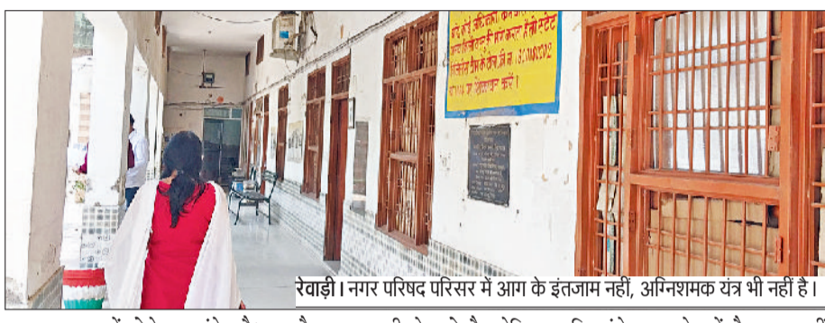
रेवाड़ी। नगर परिषद परिसर में आग के इंतजाम नहीं, अग्निशमक यंत्र भी नहीं है।

बावल कंपनी में तीन दिन पहले हुई घटना के बाद भी शहर में आगजनी से निपटने के इंतजाम फीके नजर आ रहे हैं। सरकारी कार्यालयों से लेकर स्कूलों और प्राइवेट इमारतों में आग से सुरक्षा बचाव के लिए फायर एक्सटिंग्विशर यानि अग्निशमक यंत्र लगाने अनिवार्य हैं। इन यंत्रों से आगजनी की मामूली घटना पर तत्काल रोक लगाने से मदद मिल जाती है। इसके लिए यह आवश्यक है कि इन यंत्रों की समय पर रिफिलिंग भी की जाए। वर्तमान में जिला सचिवालय को छोड़कर अन्य विभागों में लगे अग्निशमक यंत्रों के