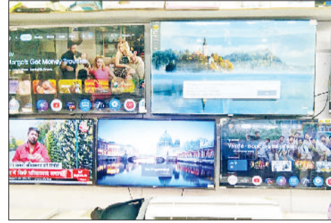
रेवाड़ी। रेलवे रोड पर एक दुकान में रखे एसी, गोकल गेट के पास एक दुकान में रखी एलईडी टीवी व एक दुकान में बिकने के लिए रखे कूलर।