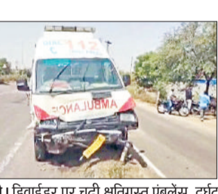
रेवाड़ी। डिवाइडर पर चढ़ी क्षतिग्रस्त एम्बुलेंस, दुर्घटना में घायल व्यक्ति।