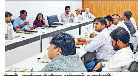
रेवाड़ी। कार्यक्रम में मौजूद अधिकारी व कर्मचारी।