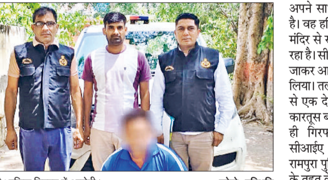
रेवाड़ी। पुलिस गिरफ्तार में आरोपी।