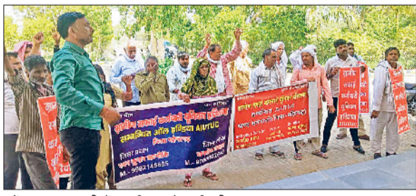
महेंद्रगढ़। सतनाली में प्रदर्शन करते कर्मचारियों।