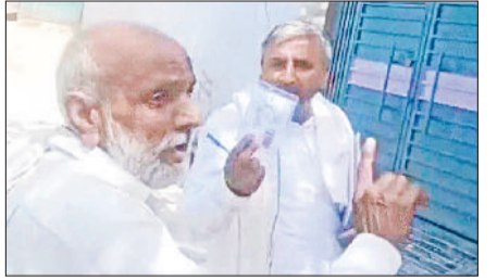
रेवाड़ी। प्रणालय से उलझते हुए बुजुर्ग एवं पड़ोसियों से झगड़ा करते बुजुर्ग।