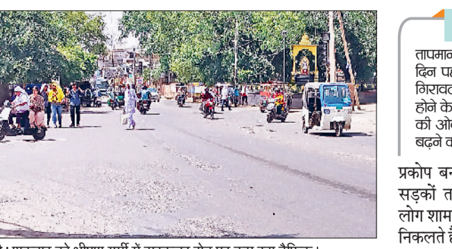
रेवाड़ी। शुक्रवार को भीषण गर्मी में सरकुलर रोड पर कम रहें ट्रैफिक।

को सुबह से ही आसमान साफ बना रहा। लगभग 10 बजे के बाद से गर्म हवाएं चलनी शुरू हो गईं। अधिकतम तापमान 1.5 डिग्री की कमी के साथ 43.0 डिग्री सेल्सियस पर आ गया। बीते मंगलवार से दो दिन तक यह 45.5 डिग्री सेल्सियस रहा था। न्यूनतम तापमान भी 2.2 डिग्री सेल्सियस की कमी के साथ 26.8 डिग्री सेल्सियस दर्ज किया गया। रात का तापमान तीन दिन से सामान्य से अधिक बना हुआ था। हवा में नमी का स्तर 19 प्रतिशत तक रहा, जबकि दिन में हवाओं की