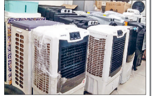
रेवाड़ी। रेलवे रोड पर एक दुकान में रखे एसी, गोकल गेट के पास एक दुकान में रखी एलईडी टीवी व एक दुकान में बिकने के लिए रखे कूलर।