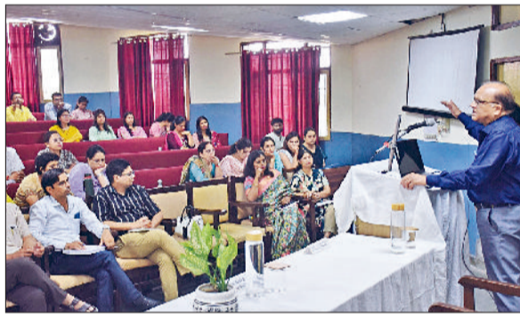
रेवाड़ी। कार्यशाला में जानकारी देते हुए वक्ता।