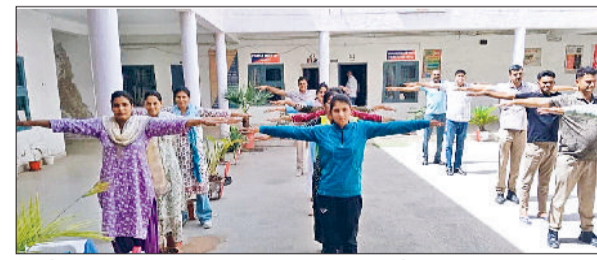
रेवाड़ी। पुलिस थाने में योगाभ्यास करते हुए पुलिस कर्मी व पुलिस लाइन में योगाभ्यास करते पुलिस कर्मी।

आगामी 21 जून को आयोजित होने वाले 12वें अंतरराष्ट्रीय योग दिवस के उपलक्ष्य में जिला पुलिस की ओर से योग प्रशिक्षण शिविर का आयोजन किया जा रहा है। शुक्रवार को जिले के सभी थाना-चाँकियों और पुलिस लाइन में योग प्रोटोकॉल प्रशिक्षण शिविर का आयोजन किया गया। कार्यक्रम में पुलिस अधिकारियों एवं कर्मचारियों को शारीरिक व मानसिक रूप से स्वस्थ