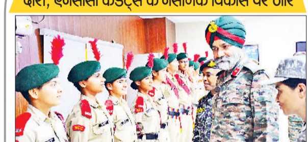
रेवाड़ी। सैनिक स्कूल में एनसीसी कैडेट्स से मिलते ग्रुप कमांडर ब्रिगेडियर।