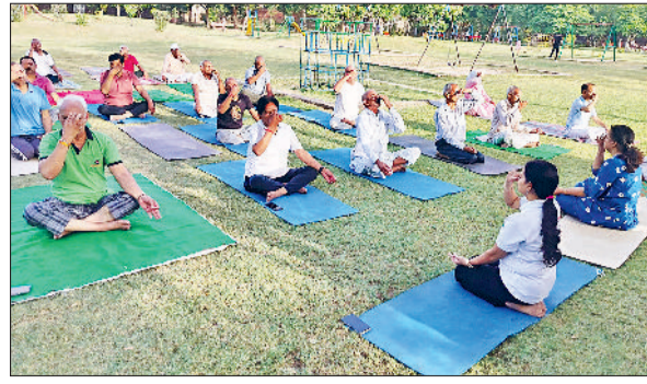
रेवाड़ी। योगाभ्यास करते हुए लोग।