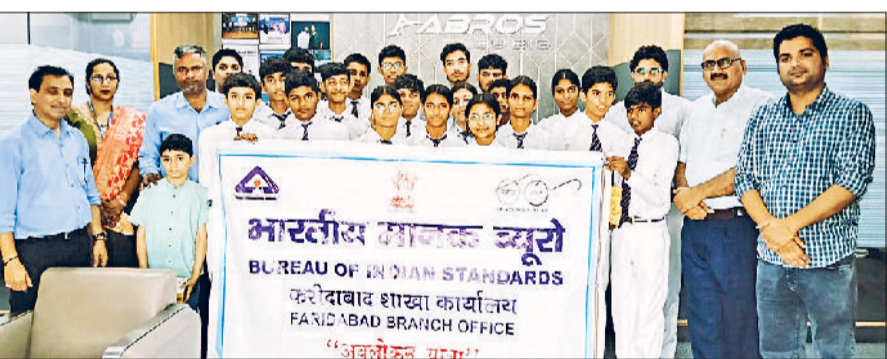
रेवाड़ी। भ्रमण के दौरान मौजूद शिक्षक व विद्यार्थी।