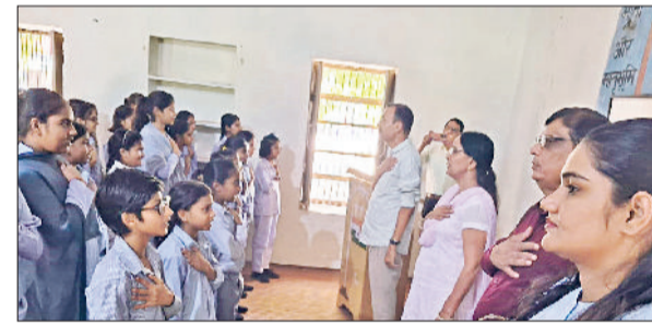
रेवाड़ी। विद्यार्थियों को शपथ दिलाते हुए पुलिस टीम।